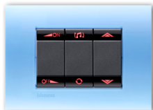
Living & Light : une révolution design et technologique

Début 2011, les nouvelles gammes d'appareillage Living & Light ont révolutionné l'offre Bticino en Italie pour le tertiaire et le résidentiel avec un contenu technologique très innovant : moteur hautement performant, solutions électroniques d'économies d'énergie, intégration de la technologie radio Zigbee, nouvelles fonctionnalités... Living & Light, c'est aussi un design très contemporain avec des lignes minimalistes, une grande variété de finitions et des matières nouvelles, de la soie au plastique translucide.