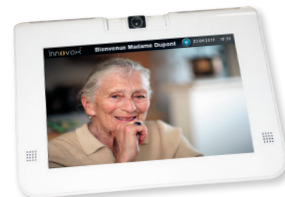
Tablette communicante Visiovox d'Intervox.

Autre exemple : le rachat d' Intervox Systèmes , leader des systèmes pour téléassistance en France, permet à Legrand de devenir n°1 français des systèmes électriques dédiés à l'assistance à l'autonomie, un marché en pleine expansion soutenu à la fois par une demande grandissante de la part des seniors qui souhaitent majoritairement rester à leur domicile, et par les pouvoirs publics qui encouragent cette démarche face à la forte augmentation démographique de cette classe d'âge.